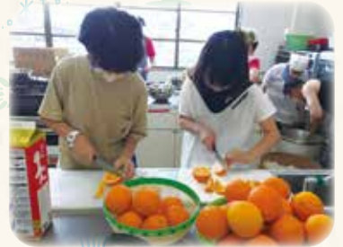
積極的にお手伝い!