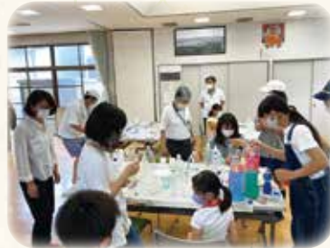
スライムづくりおもしろいね♪