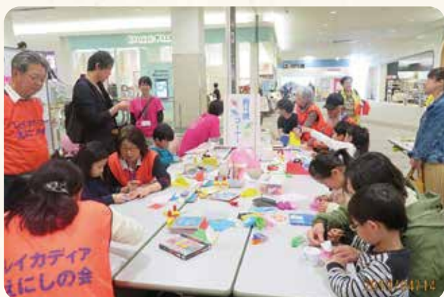
折り紙コーナーでの子どもたち