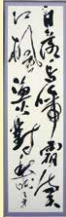
「楓橋夜泊」 今井 光華