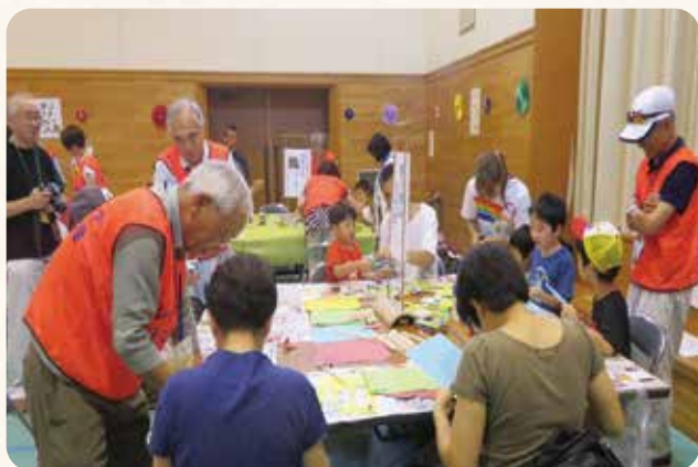
紙飛行機を作りました(子ども食堂フェスタにて)