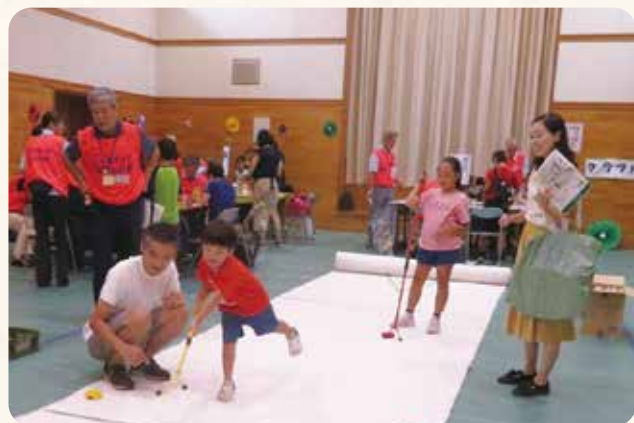
スポーツコーナー(子ども食堂フェスタにて)