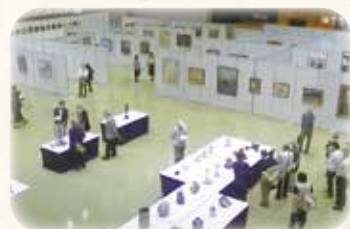
▲県立文化産業交流会館会場(全作品展示)