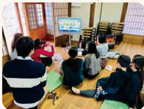
様々な年齢の仲間とゲームに熱中