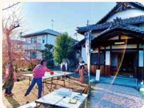
遍照寺の前庭で卓球を楽しむ

また、私自身も、過去どう生きてきたかではなく、これからどう生きるかを大事に、仲間とともに活動を続けていきたいです。