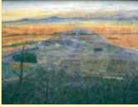
「影富士(近江富士)」 中島 勝