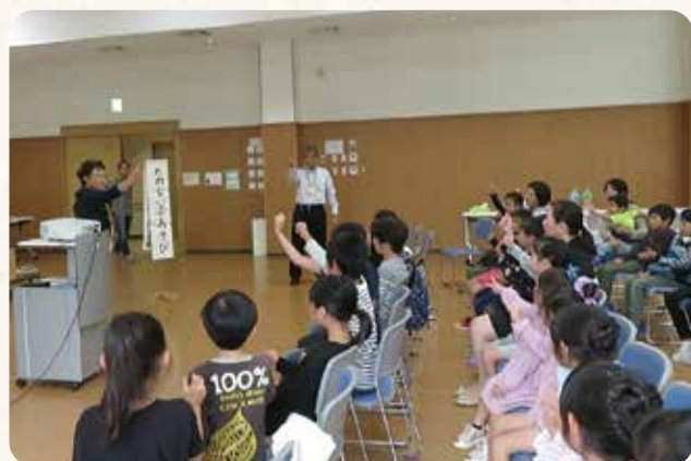
手あそびを楽しむ子どもたち