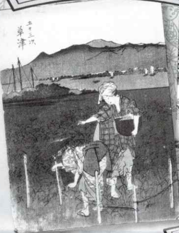
▲歌川広重画「五十三次 草津」 村田屋市五郎板

わかりやすい説明と大きな挿絵。 旅の案内書「名所図会」は 編者と絵師がタッグを組んで売上げ急上昇。 旅の浮世絵ネタは名所図会で探せ！