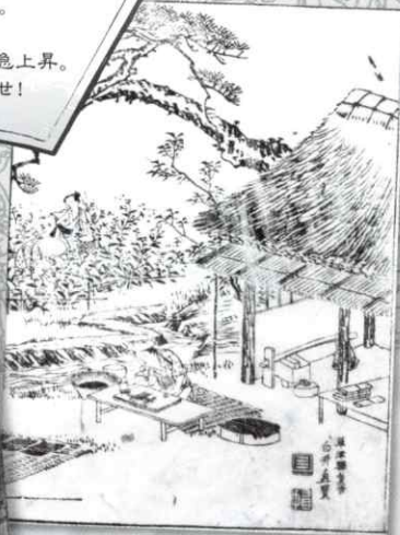
▲「東海道名所図会」青花(草津市蔵)部分