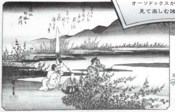
▲歌川広重画「諸国六玉川 近江野路之玉川」萬屋重三郎板(草津市蔵)

定番ネタにひと工夫！ テイストの違った近江八景。 オーソドックスから見立てまで！ 見て楽しむ諸国六玉川。