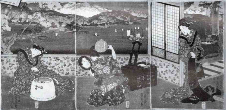
歌川(玉蘭齋)貞秀画「今様近江八景」藤岡屋慶次郎板(草津市蔵・中神コレクション)▲

史跡草津宿本陣 一般公開再開のお知らせ 史跡草津宿本陣は耐震工事を終え、4月1日(火)より、 一般公開を再開いたします。