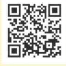
大会参加申込専用ホームページURL

※「募集句投句用紙」は、ねんりんピック岐阜2025の大会ホームページからダウンロードできますのでご利用ください。