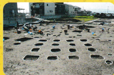
霊仙寺遺跡 高床倉庫