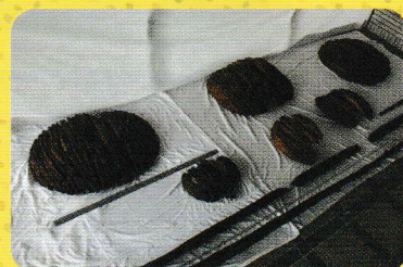
椿山古墳 笠形木製品