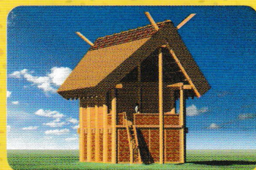
下鉤遺跡 大型建物復元図