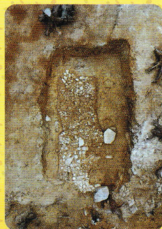
北尾遺跡 A-1号墳石室