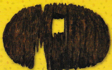
椿山古墳 笠形木製品