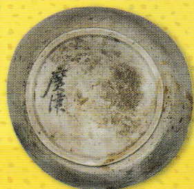
霊仙寺遺跡 「廣津」墨書土器