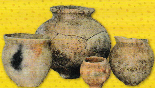
霊仙寺遺跡 土師器