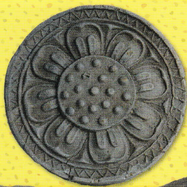
蜂屋遺跡 法隆寺式軒瓦