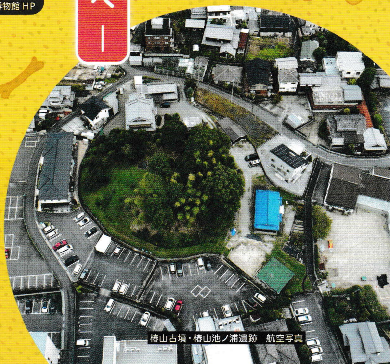
椿山古墳・椿山池ノ浦遺跡 航空写真