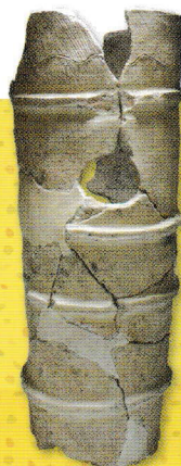
小柿遺跡 円筒埴輪