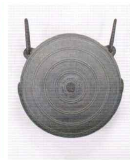
罎口 鎌倉時代 重要文化財