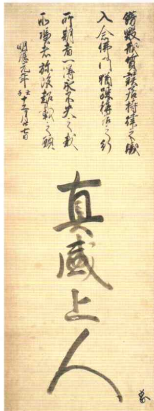
後土御門天皇宸翰真盛上人号 室町時代 重要文化財