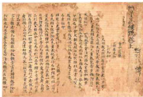
無量義経疏 平安時代 重要文化財