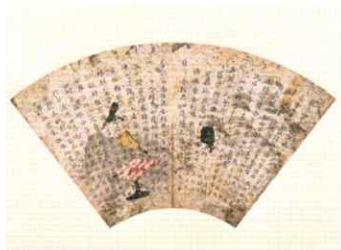
扇面法華経 平安時代 重要文化財