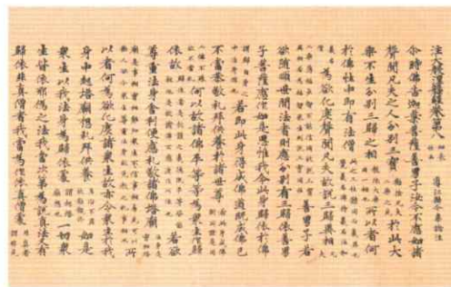
注大般涅槃経巻第八 奈良時代 重要文化財