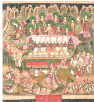
甘露図 朝鮮時代・宣祖24年(1590)

【表写真(中央)】観経变相図 鎌倉時代 重要文化財 【裏背景】十念名号 真盛上人筆