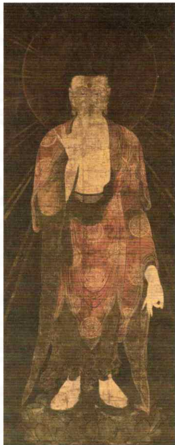
阿弥陀如来像 鎌倉時代 重要文化財