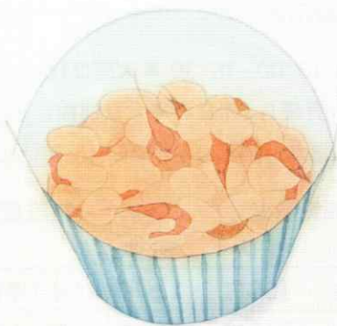
ILLUSTRATION : SHIHO NAITO