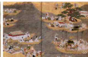
琵琶湖に運ばれる神饌／日吉山王祭礼図屏風(部分・当館蔵)