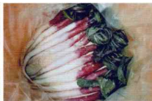
桶に漬けられる日野菜