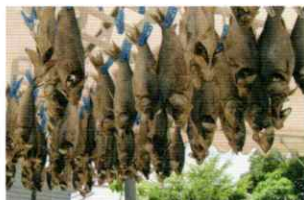
飯漬け前の塩切りぶな

湖国の食事のいまとこれからをつくるのは、そこに暮らすわたしたち。湖国で育まれてきた食材と、それを生かす知恵と技。その豊かさに触れ、生活に取り入れるきっかけとなれば幸いです。