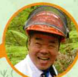
遠賀県知事 三日月 大造

13:00 表彰等セレモニー 13:40 トークセッション 14:20 記念植樹 (広場周辺部) チェーンソーアート実演会 (広場内)