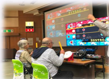
eスポーツ(選択講座)