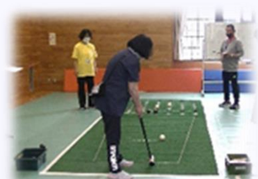
ニュースポーツ大会