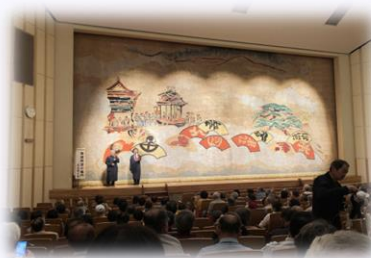
草津・彦根合同 基礎講座